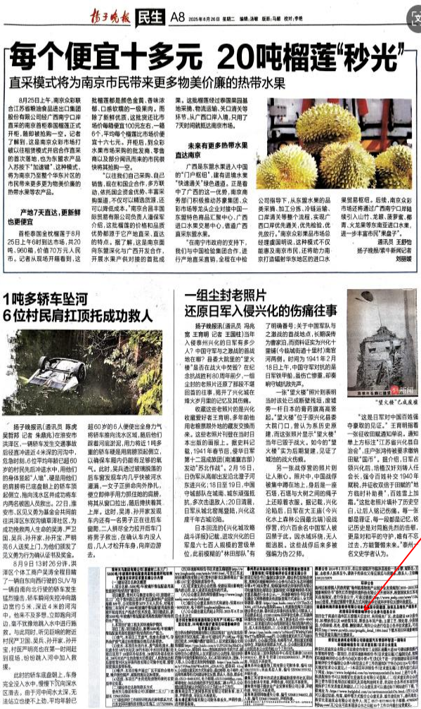
图 3-2 第一次报纸公示截图

建设单位于2025年8月26日和2025年8月27日在扬子晚报进行了两次公示。报纸公示的相关截屏见图3-2、图3-3。