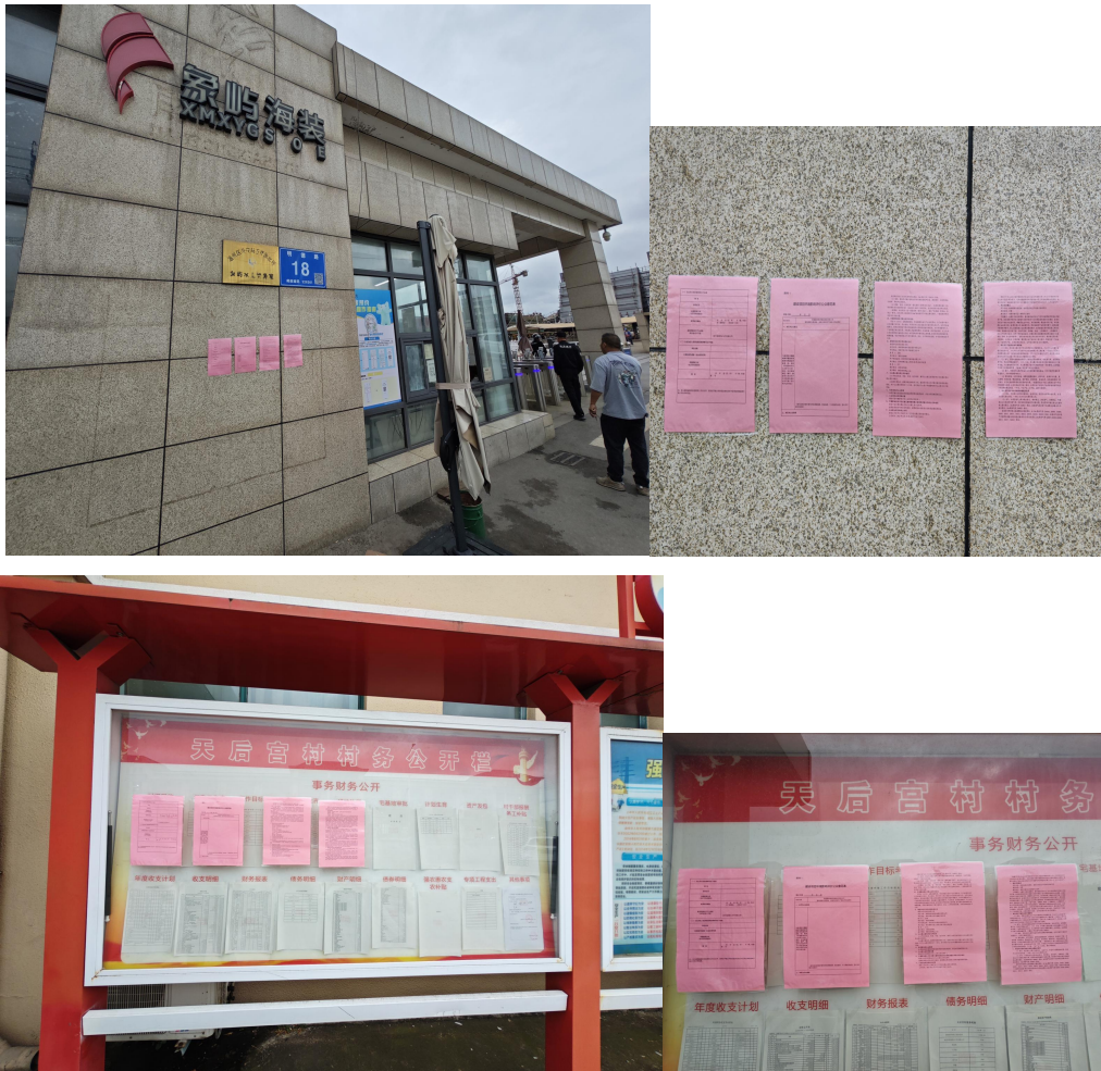
图 3-4 张贴公告照片图

公示时间：2025 年 8 月 15 日-8 月 28 日，符合《环境影响评价公众参与办法》第十一条：“通过在建设项目所在地公众易于知悉的场所张贴公告的方式公开，且持续公开期限不得少于 10 个工作日”。