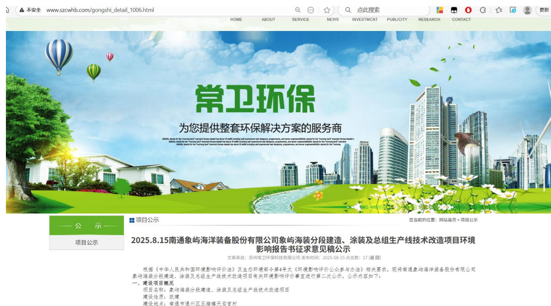
图 3-1 第二次网上公示截图