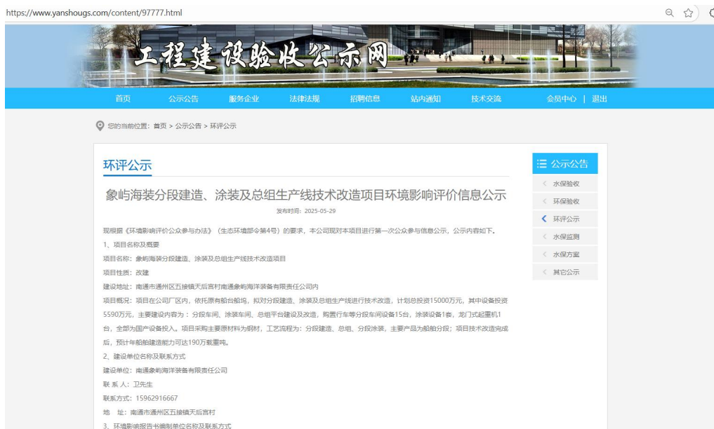
图 2-1 第一次网上公示截图