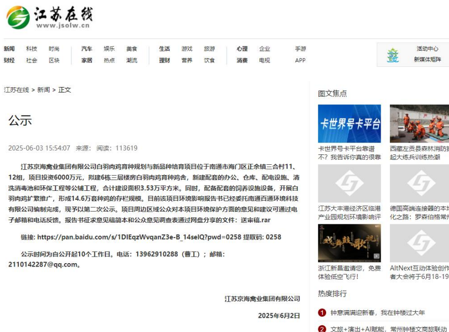
图3.1 第二次网络媒体公示截图

在江苏在线 http://www.jsuolw.cn/xinwen/1120838.html 进行了第二次媒体公示（10个工作日）第二次网络媒体公示截图见图3.1。