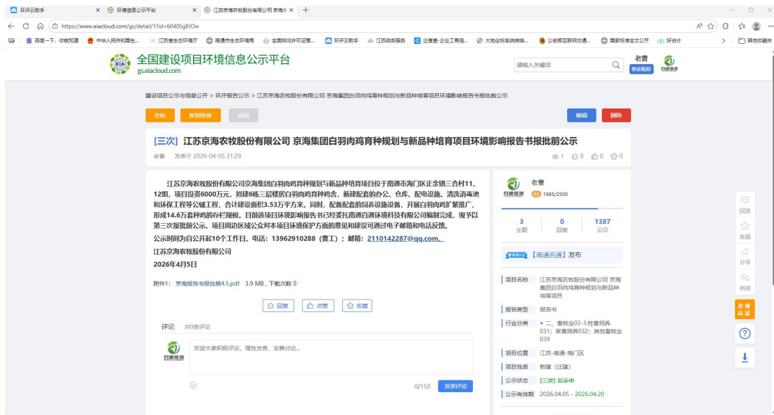
图3.5 第三次报批前网络媒体公示截图