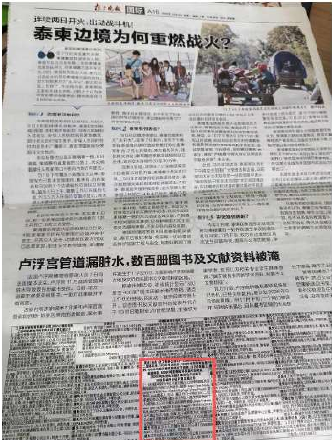
图 3-2 报纸公示截图