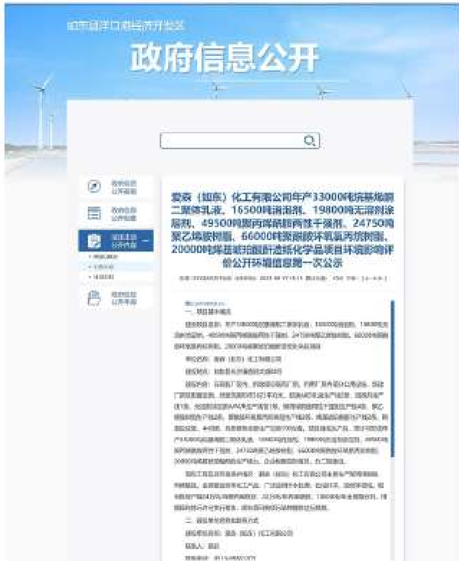
图 2-1 第一次网络公示截图