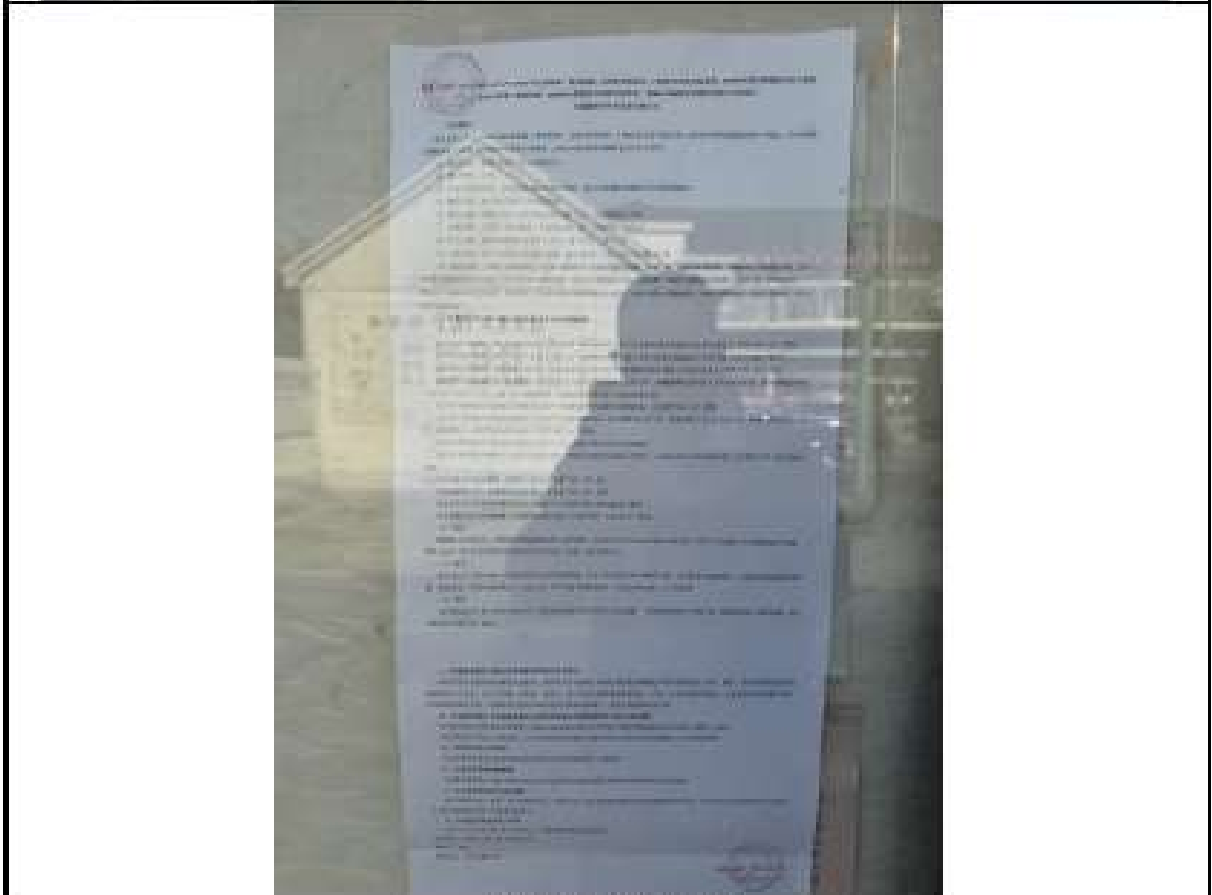
长堤村宣传公示栏