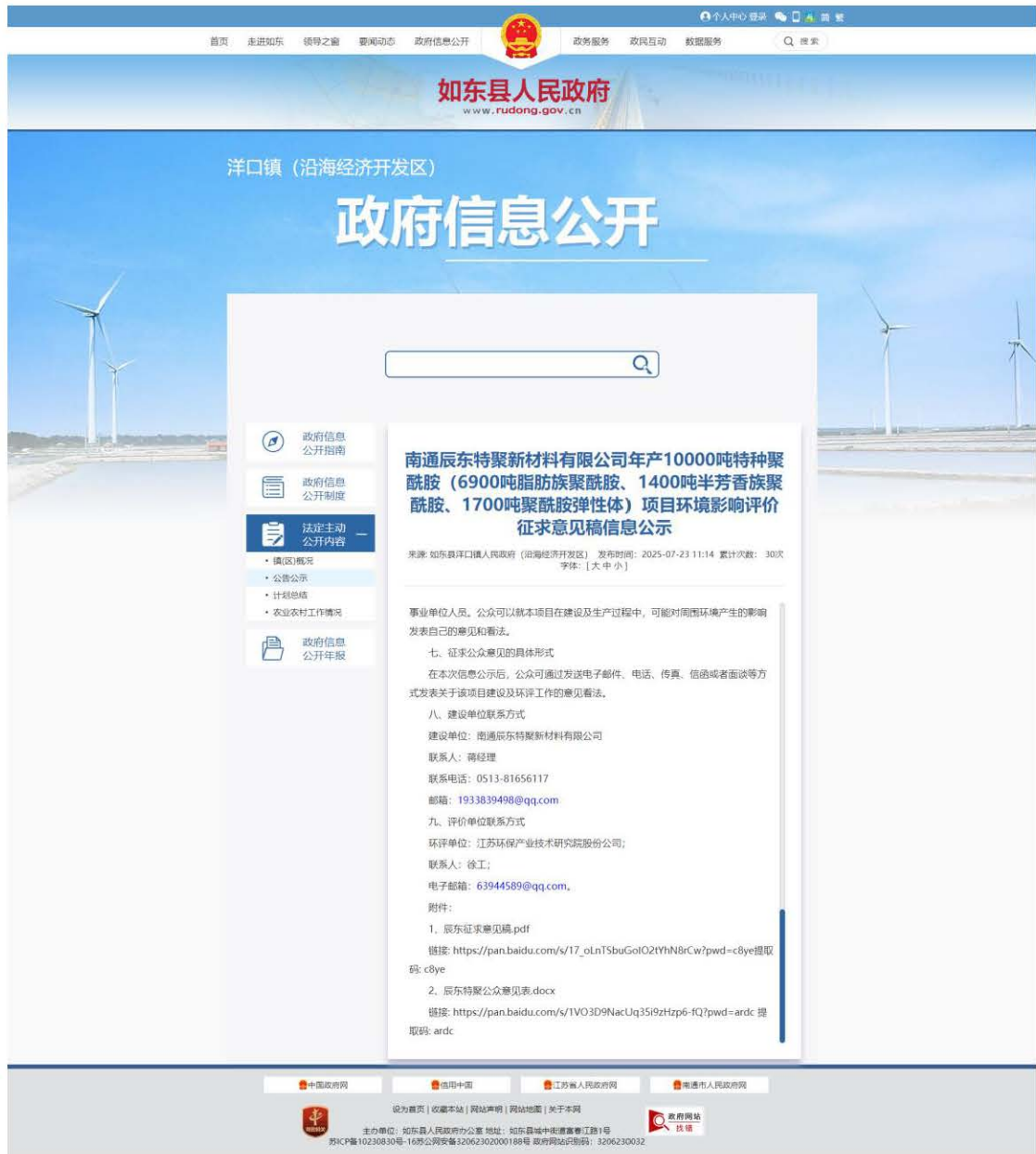
图 3-1 征求意见稿网上公示截图