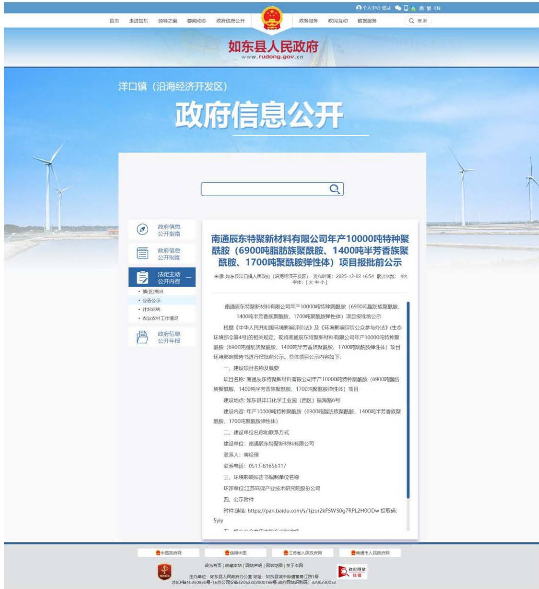
图 6-1 报批前网上公示截图