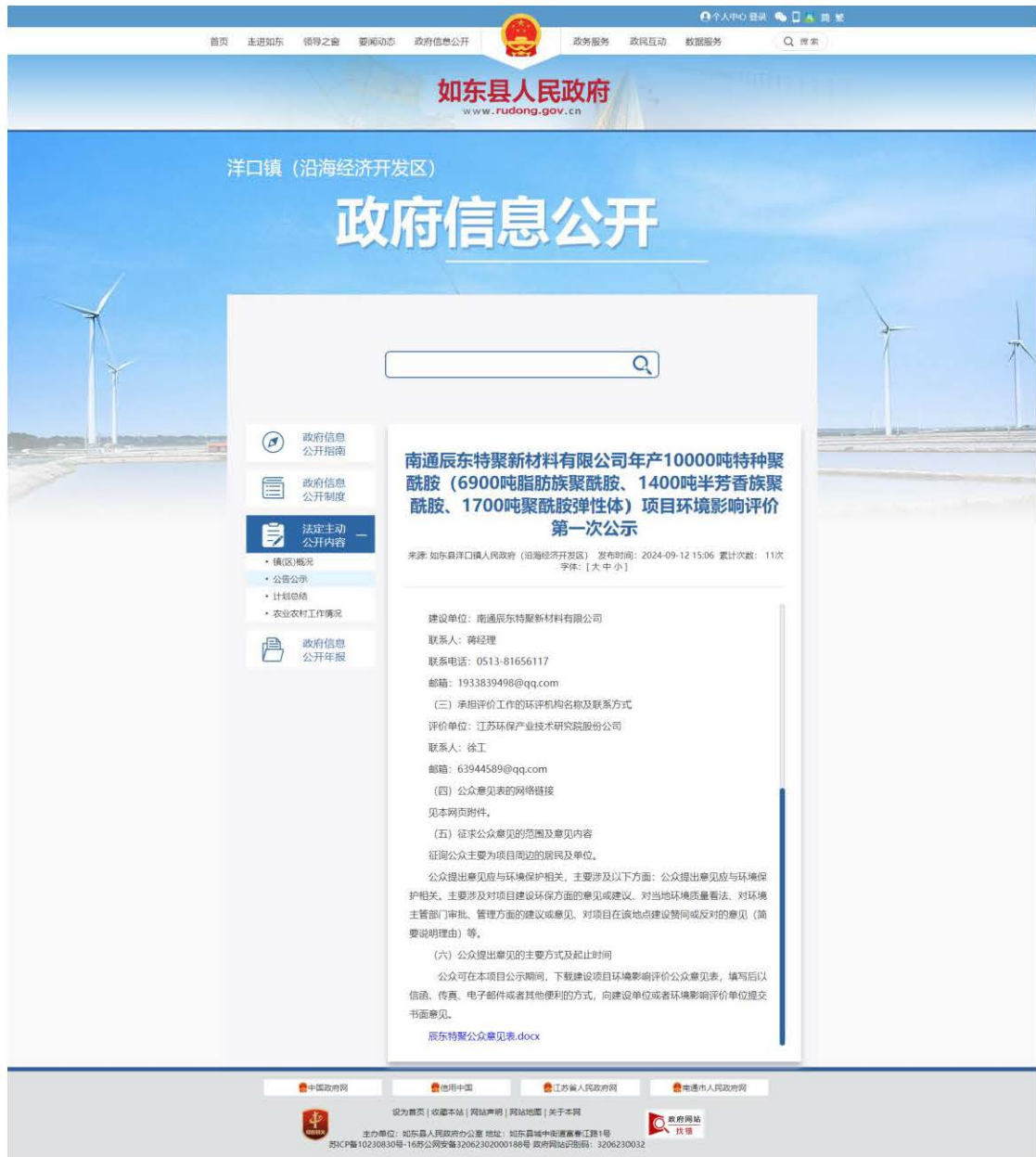
图 2-1 第一次网上公示截图