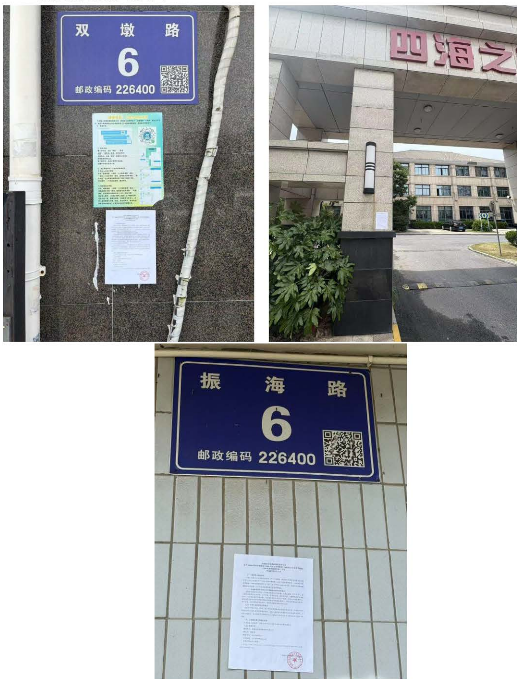
图 3-4 张贴公告照片图